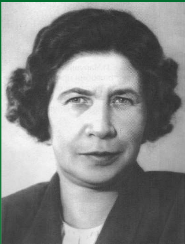
Валентина Александровна Осеева (1902-1969)